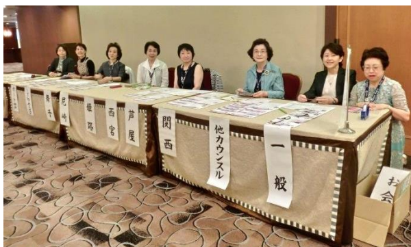
姫路クラブのみなさん

今期最後の会合とあり、どこか緊張感のある表情。 会場のテーブルには素敵な花のアレンジが飾られていた。